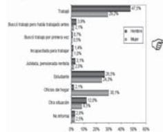
Población de 5 años y más, censada en hogares particulares, por actividad realizada la semana anterior, por sexo (área urbana)