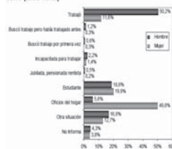
Población de 5 años y más, censada en hogares particulares, por actividad realizada la semana anterior, por sexo (área rural)